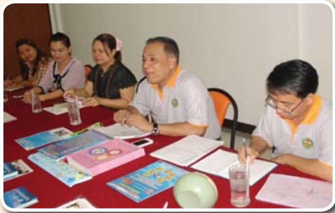
ทีมงานกำลังถอดบทเรียนร่วมกับเจ้าหน้าที่ศูนย์อนามัยที่ ๗