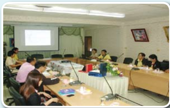
การพูดคุยกับประธานและกรรมการชมรมฯ เพื่อถอดบทเรียน