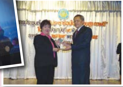
ชมรมผู้ประกอบการค้าอาหารดีเด่น ปี ๒๕๕๐ และ ๒๕๕๕