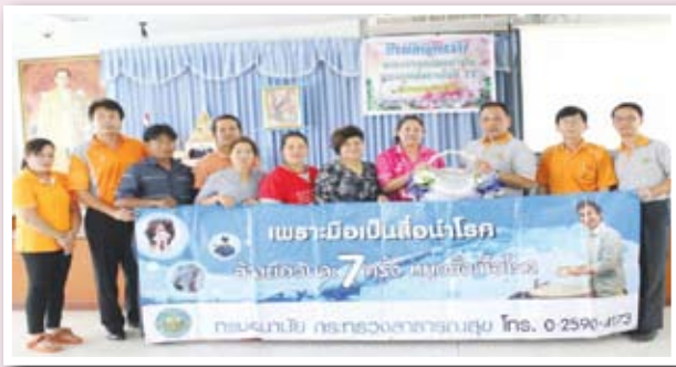
มอบเอกสาร สื่อประชาสัมพันธ์งานสุขาภิบาลอาหารให้แก่ชมรมฯ