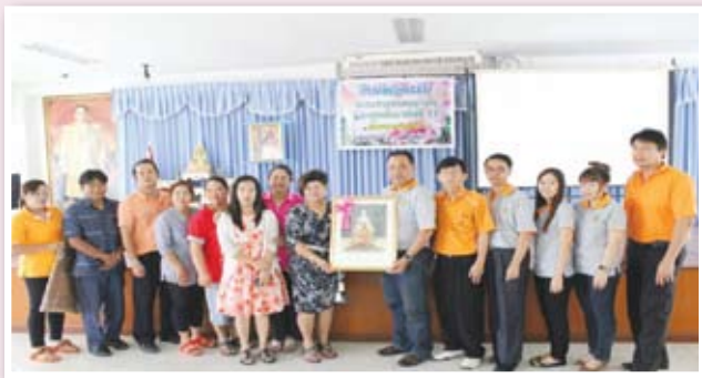
ทีมงานถอดบทเรียนรับมอบของที่ระลึกจากผู้บริหารเทศบาลและชมรมฯ