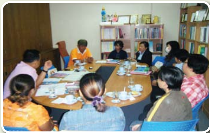
ประธานและคณะกรรมการชมรมฯ ร่วมถอดบทเรียน