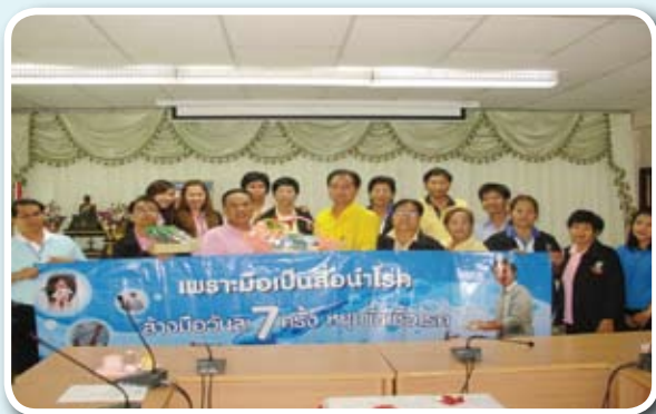
มอบสิ่งสนับสนุน สื่อ เอกสาร สนับสนุนงานชมรมฯ