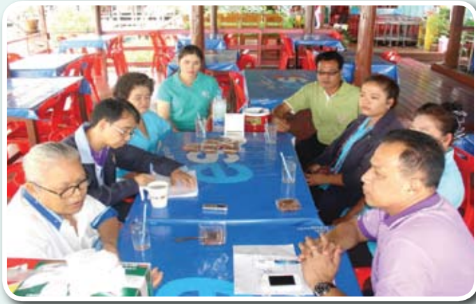
การพูดคุยถอดบทเรียนกับประธานและกรรมการชมรมฯ