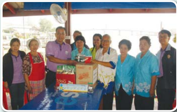
มอบสิ่งสนับสนุน สื่อ เอกสาร สนับสนุนงานแก่ชมรมฯ