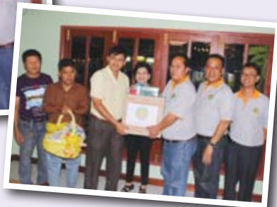
มอบสื่อประชาสัมพันธ์แก่ชมรมผู้ประกอบการร้านอาหารจังหวัดตรัง