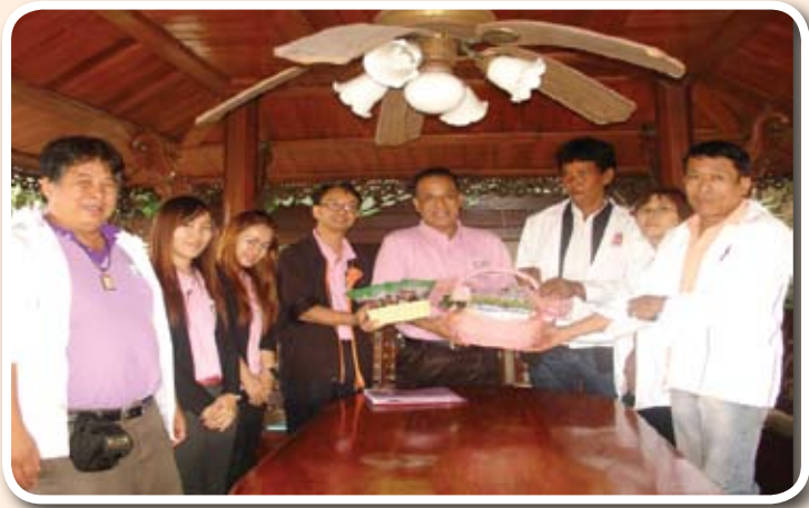
มอบสิ่งสนับสนุน สื่อ เอกสาร สนับสนุนงานชมรมฯ