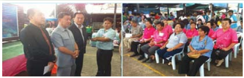
นายกเทศมนตรีคนใหม่ พบปะสมาชิก