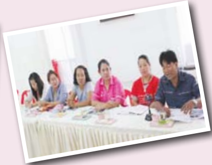
ผู้บริหารเทศบาล ภาศิเครือข่ายและคณะกรรมการชมรมฯ ร่วมถอดบทเรียน