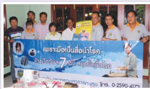
มอบสื่อประชาสัมพันธ์แก่เจ้าหน้าที่จากสำนักงานสาธารณสุขจังหวัดตรัง