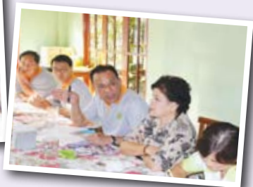
การพูดคุย ถอดบทเรียนกับประธานชมรมฯ