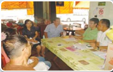
เจ้าหน้าที่สำนักงาน สาธารณสุขจังหวัดบุรีรัมย์ พูดคุยถอดบทเรียน