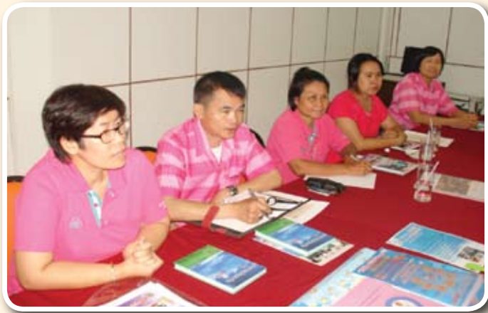
ประธานและคณะกรรมการชมรมฯ ร่วมสนทนาถอดบทเรียน