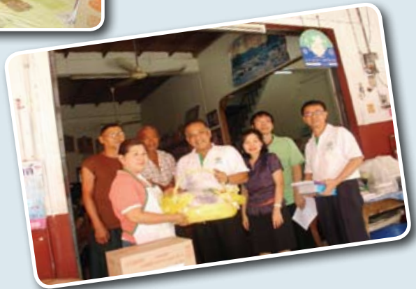
มอบสิ่งสนับสนุน สื่อ เอกสาร สนับสนุนงานแก่ชมรมฯ