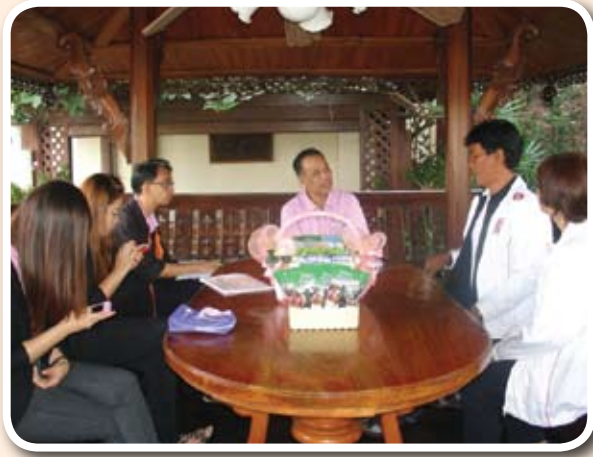
การพูดคุยกับประธานและคณะกรรมการชมรมฯ เพื่อถอดบทเรียน