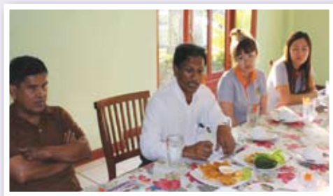
เจ้าหน้าที่จากสำนักงานสาธารณสุขจังหวัดตรังร่วมถอดบทเรียน