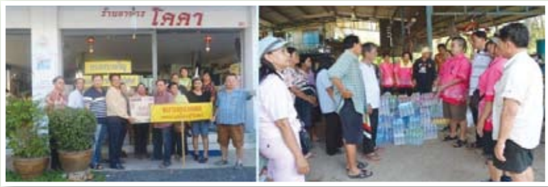
บริจาคของช่วยน้ำท่วม