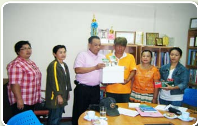
มอบวัสดุ เอกสารสิ่งพิมพ์งานสุขาภิบาลอาหาร แก่คณะกรรมการชมรมฯ