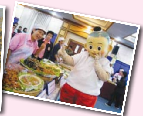
ร่วมจัดงานมหกรรมอาหาร จังหวัดพิษณุโลก ต้นตำรับข้าวผัดสี่แยกอินโดจีน