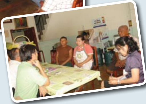
การพูดคุยถอดบทเรียนกับประธานชมรมฯและกรรมการชมรมฯ